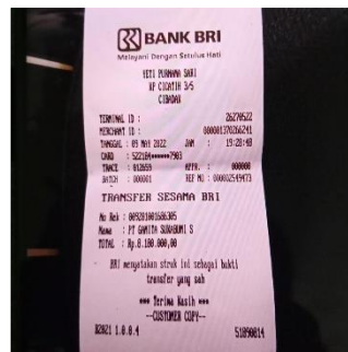
Transaksi Yang Dilakukan Dalam Pembayaran