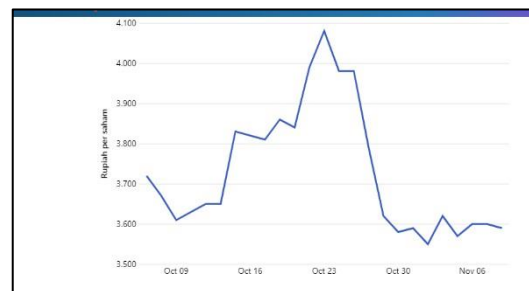
Grafik 1.1 Gerak Saham PT. Unilever Indonesia yang Menjadi Target Boikot

Selain itu, Vivek Agarwal selaku Direktur Keuangan dari PT Unilever Indonesia mengungkapkan Efek dari panggilan untuk memboikot barang-barang yang terkait dengan Israel dan perusahaan terkaitnya mempengaruhi kinerja bisnis saat memasuki kuartal terakhir tahun 2023. Penurunan yang paling mencolok terjadi pada bulan November dan Desember 2023. ujarnya. Akibat dari perubahan sentimen tersebut, penjualan domestik kumulatif pada tahun 2023 mengalami penurunan sebesar 5,2%. “Kami terkena dampak sentimen negatif konsumen terkait penjualan dalam negeri,” ujarnya. (Putri, 2024).